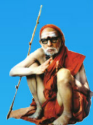
గురు చంద్రశేఖర పరమాచార్య