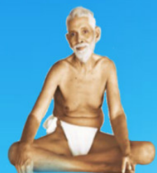
గురు రమణ మహర్షి