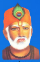
గురు కబీర్ దాస్