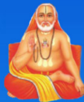
గురు రాఘవేంద్ర స్యామి