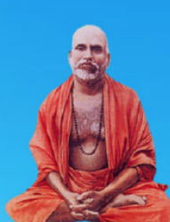
గురు మహయాళ స్యామి