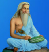
గురు వాల్మీకి మహర్షి