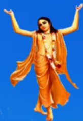
గురు చైతన్య మహా ప్రభువు