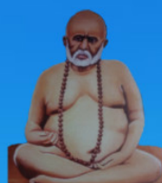
గురు వైలింగ్ స్యామి