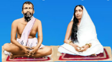
గురు రామకృష్ణ పరమహంస అమ్మ కారదా దేవి