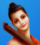
గురు నారద మహర్షి