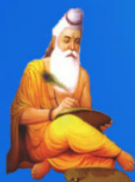
గురు వేదవ్యాని మహర్షి